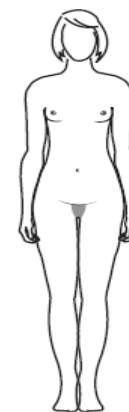
hanches plus larges, plus étroit au niveau des épaules