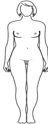
plus grand et plus rond