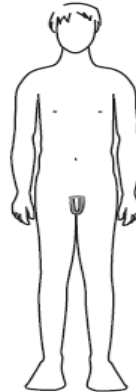
ni plus grand ni plus rond