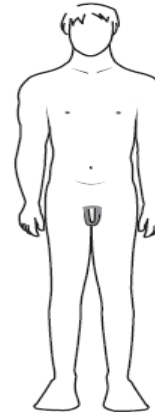
plus large au niveau des épaules