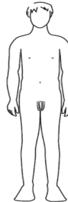
plus grand, toujours