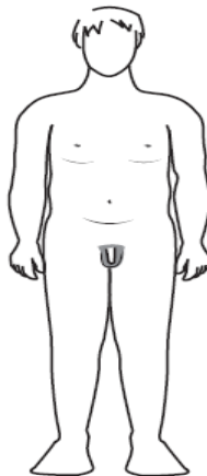
plus grand et plus rond